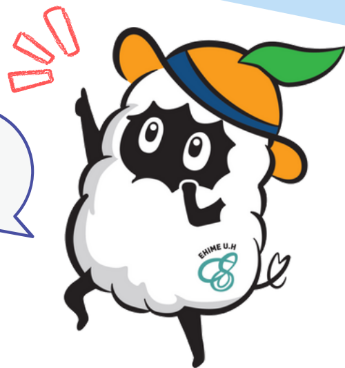
Mr. Sheep (ミスターシープ)