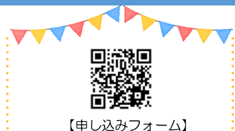
【申し込みフォーム】

〒790-0003 松山市三番町6丁目4-20 (公財)松山市男女共同参画推進財団 事業係 TEL/(089)943-5777 FAX/(089)943-0460 E-mail/ event@coms.or.jp 休館日：月曜日(祝日の場合は翌日)