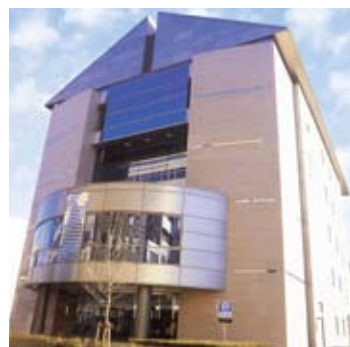
松山市男女共同参画推進センター COMS (コムズ)