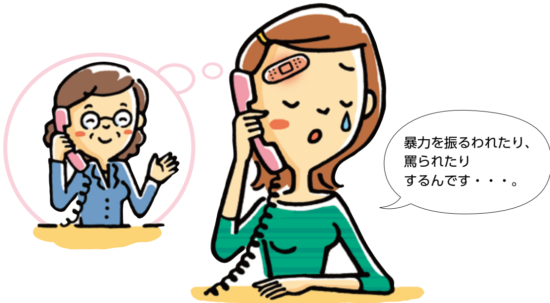
配偶者からの被害経験

「身体的暴行」、「心理的攻撃」、「性的強要」のいずれかを1つでも受けたことがある