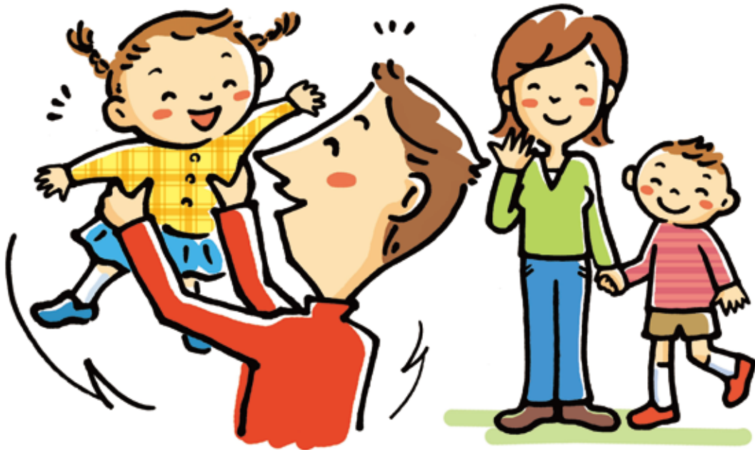
男女計の家事・育児時間に占める男性の時間割合