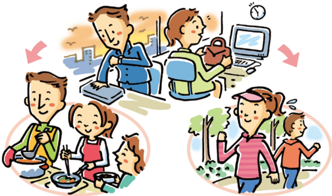
週労働時間が50時間以上の労働者の割合