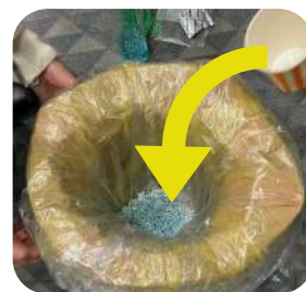
くるくる巻きトイレ作成