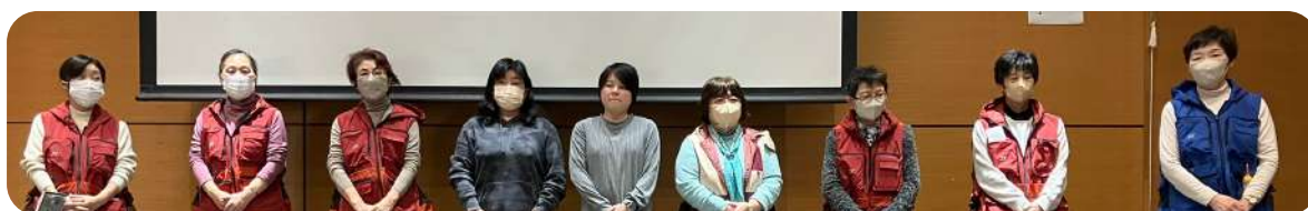
女性と防災の会 の皆様

今回の講座では、災害時において私たちが今日から行うトイレ対策を中心にご講演いただきました。