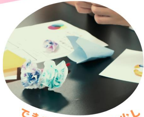
できあがりまであと少し