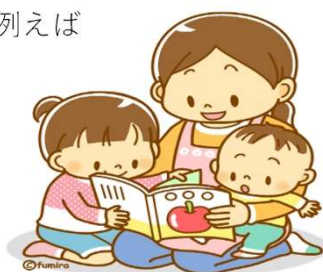
一緒に子どもと遊んだり