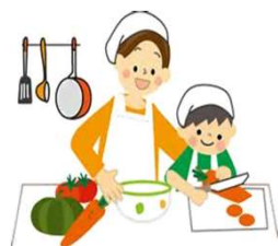
一緒に家事をしたり