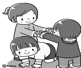
一緒に他の親子の集まる場所に行ったり