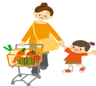
一緒に公園や買い物に行ったり などなど

すべての子どもがより良き人生のスタートをきれよう、あなたのご来場をお待ちしています。