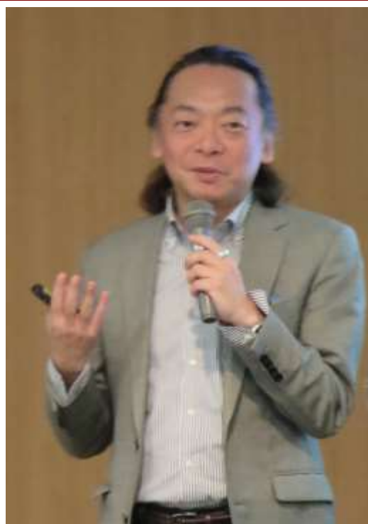
講師:NPO法人ファザーリングジャパン ファウンダー/代表理事

1962年生。出版社、IT企業など9回の転職を経て、2006年に父親支援のNPO法人ファザーリング・ジャパンを設立。「笑っている父親を増やしたい」と講演や企業向けセミナー、絵本読み聞かせなどで全国を歩く。最近は管理職養成事業の「イクボス」で企業・自治体での研修も多い。厚生労働省「イクメンプロジェクト推進チーム」顧問、にっぽん子育て応援団 共同代表等も務める。著書に『できるリーダーはなぜメールが短いのか』（青春出版社）『パパの極意～仕事も育児も楽しむ生き方』（NHK出版）など多数。3児の父親。