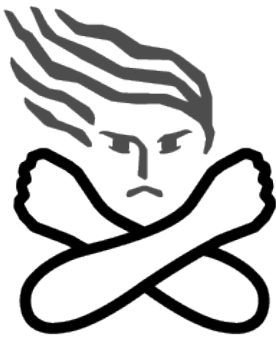
女性に対する暴力根絶のためのシンボルマーク