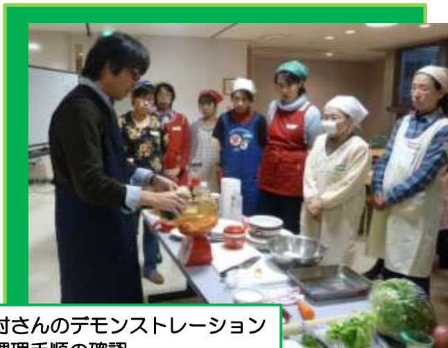
中村さんのデモンストレーション で調理手順の確認