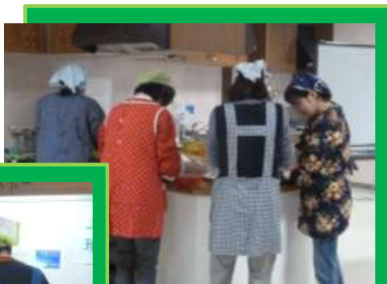
電子レンジをメインに使うことで 調理も簡単！ 火加減も気にすることなく、会話 も弾みました。